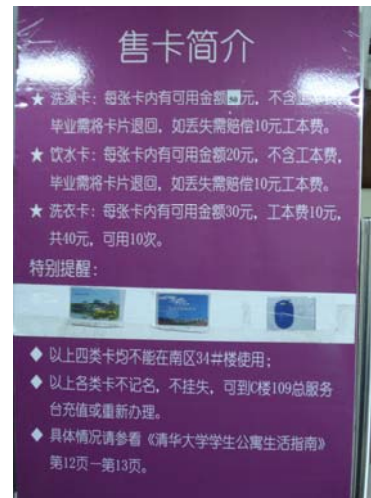
清華大學學生公寓之洗澡卡、飲水卡及洗衣卡售卡簡介

最為印象深刻的是北京學校住宿生需購買洗澡卡，第一次看到住學校宿舍需購買「洗澡卡」並儲值，經詢問校方人員表示，洗澡卡制度已施行十年了，因北京冬天天氣寒冷，需使用大量熱水，為節能減碳，施行洗澡卡制度；學生於洗澡時，將洗澡卡置於機器上，洗完後，將卡片取走，依其使用熱水量收費，以達到節能目的。