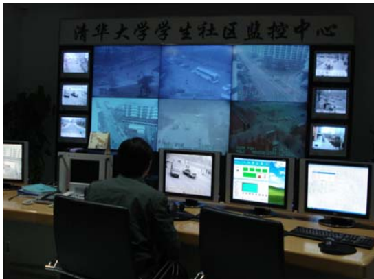
清華大學學生社區監控中心監控校園內及周圍