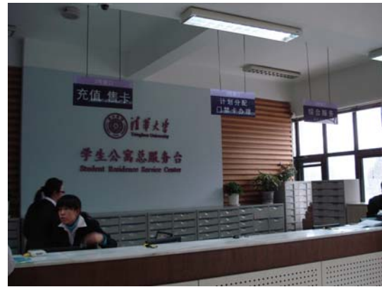
清華大學學生公寓總服務台

參觀香港學校，校方在宿舍設立讓學生自由發表意見的意見欄，從上面的留言，可知香港學校的民主；宿舍的環境、備設及文化，與大陸學校明顯不同，包括廚房、洗衣間、電腦室、會議室及娛樂空間。