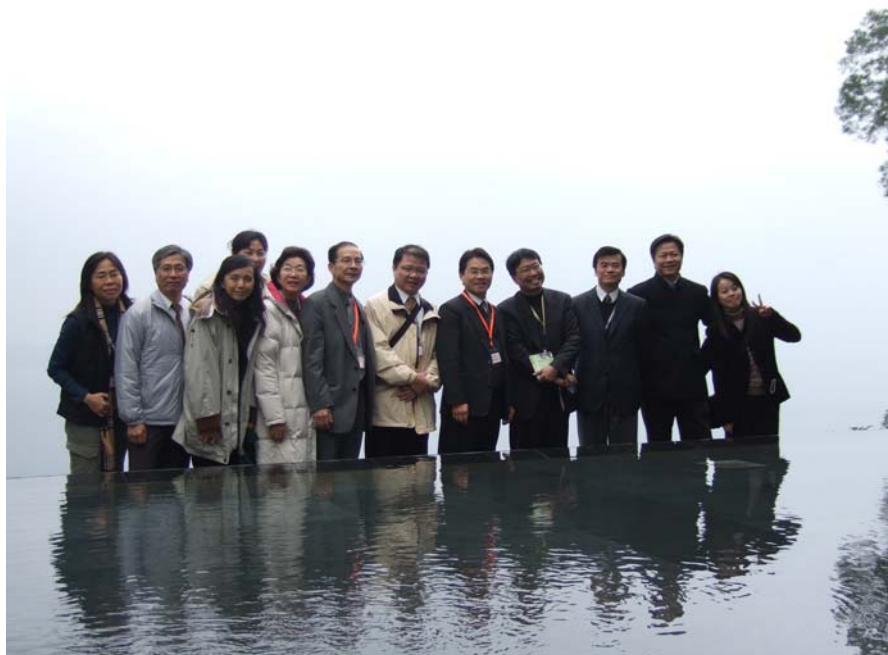
參訪行程最後一天於香港中文大學合影

七天的二岸三地學務工作參訪活動，除了對大陸及香港的學務工作更了解之外，也讓北一區各校的學務長有更進一步的認識，這不僅是與二岸三地學校的學務交流，同時也是北一區各校間的實務交流。