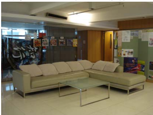
香港中文大學宿舍大廳

參觀香港學校，校方在宿舍設立讓學生自由發表意見的意見欄，從上面的留言，可知香港學校的民主；宿舍的環境、備設及文化，與大陸學校明顯不同，包括廚房、洗衣間、電腦室、會議室及娛樂空間。